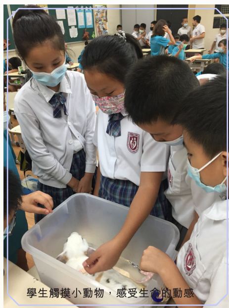
學生觸摸小動物，感受生命的動感

的精神，活出自己的精彩人生。學生於課堂上積極討論，樂意分享自己的感受，課後亦能用心完成延展功課，認為生命是寶貴的、溫暖的、可愛的，應該好好珍惜，不能做出傷害自己和他人的事。