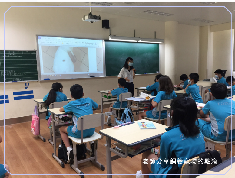
老師分享飼養寵物的點滴