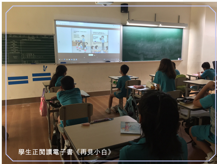
學生正閱讀電子書《再見小白》

對外界事物不再有感覺，也沒有反應。“死”是不可逆轉的，亦無從躲避，沒有人能預測死亡何時會出現，所以我們更應該珍惜生命，學會感謝父母。