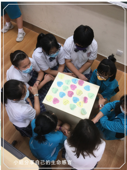
小組分享自己的生命感言