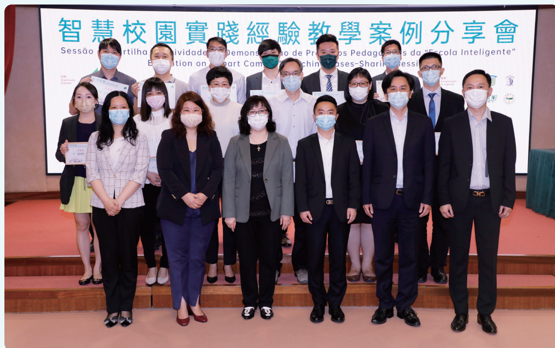
智慧校園實踐經驗教學案例分享會頒授感謝狀

為配合智慧教育的發展和應對抗疫常態化，教育及青年發展局（下稱“教育局”）2020/2021 學年推出“智慧校園”，協助學校優化日常運作及實施網上教學。經過一年的實踐，不少學校累積了豐富的經驗和心得。因此教育局於仲尼堂舉辦“智慧校園實踐經驗教學案例分享會”，邀請濠江中學、聖家學校、嘉諾撒聖心英文中學、鏡平學校、教業中學和培華中學派出教師代表，向來自 38 間學校近 70 名與會教學人員分享有關使用智慧校園和網上教學的方法及技巧。教育局丁少雄副局長、阮佩賢副局長及主管人員出席是次分享會。