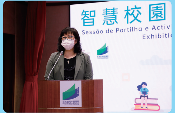
教育及青年發展局副局長阮佩賢致辭