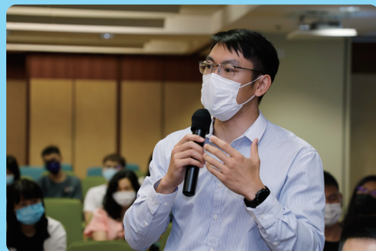
分享會中老師們分享交流

在防疫常態化下，教育界各持份者均應熟習和善用網上學習模式，逐步培養學生自主學習和探究式學習的態度和能力。教青局將持續推動學校發展“智慧教育”，協助教師更便捷、全面、準確地掌握學生的學習情況，從而減輕教師的工作量，同時提升師生的教學成效，達至減負增能的目的。🎓