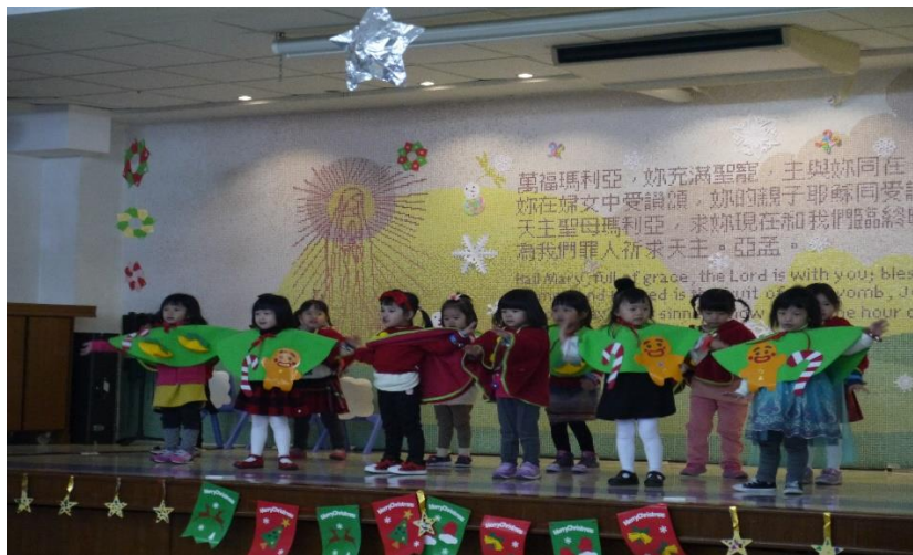
欣賞話劇《耶穌誕生了》