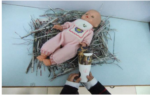
(三) 活動的延伸——幼兒參與聖誕聯歡會