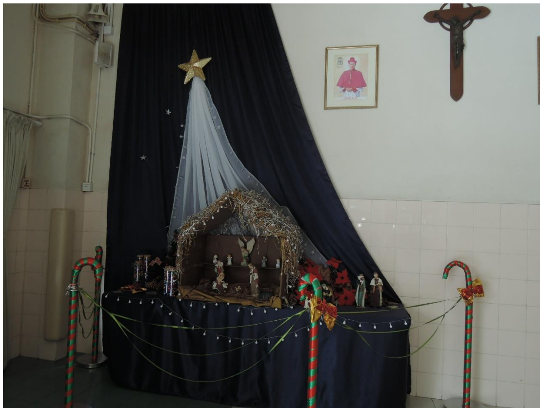
帶領幼兒所參觀的馬槽