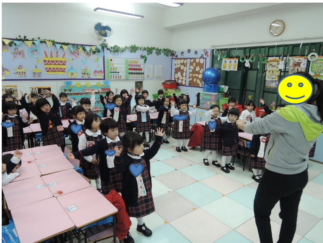
佈置工作紙，幼兒邀請父母一起完成