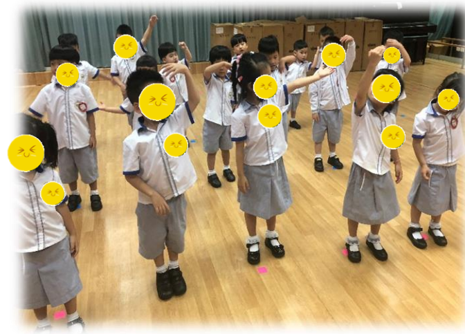
圖 8: 舒緩操