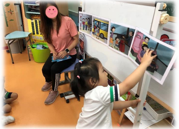
圖 2：老師與幼兒一起檢視乘坐巴士的正確步驟