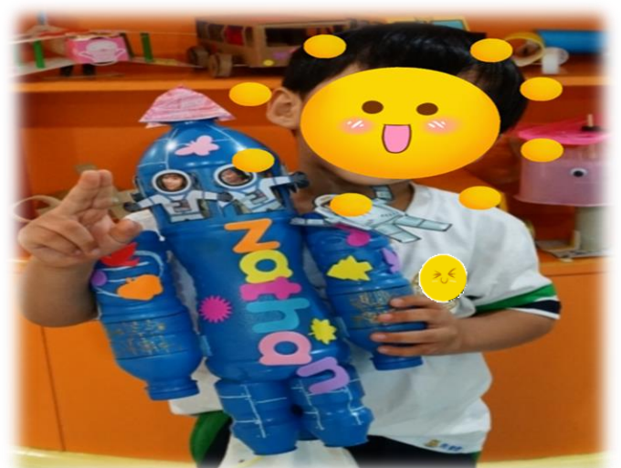
圖 6：幼兒把親手造的交通工具帶回校，與朋友分享