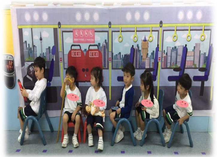
圖 7、圖 8：幼兒在巴士內部佈景板下模擬乘坐巴士的過程