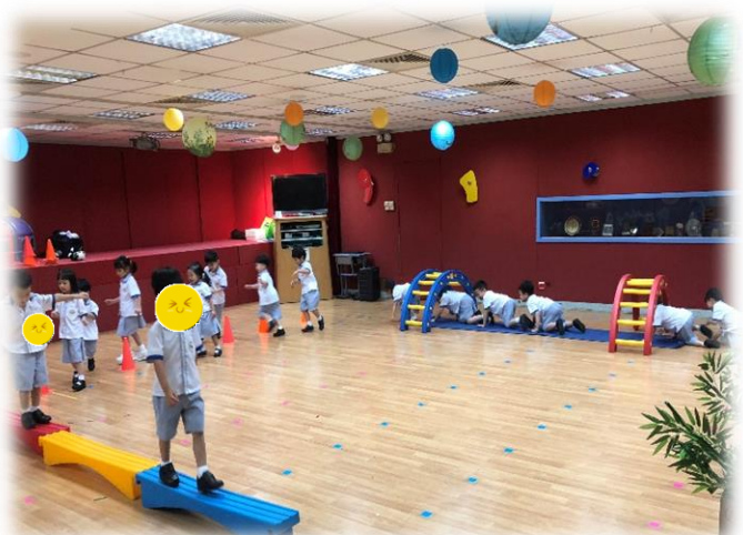
圖 6：幼兒在進行環式遊戲（綜合）