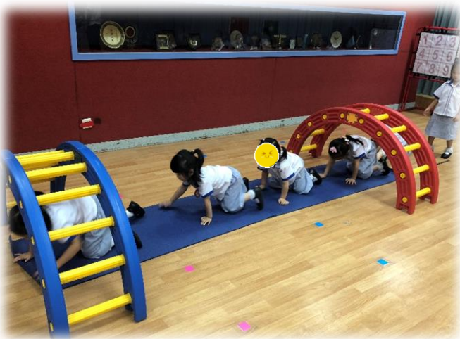
圖 3：出發啦！幼兒在爬行（松山隧道）