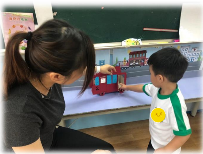
圖 5：幼兒指出小兔該從後門下車