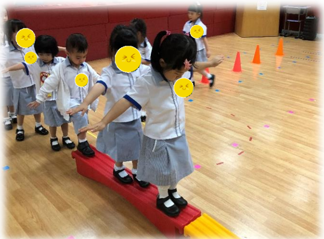
圖 5：幼兒在學習新動作---走平衡(友誼橋)