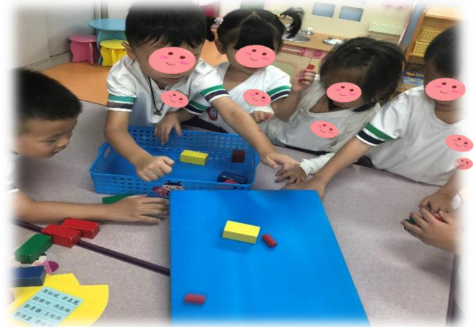
圖 3、圖 4：幼兒通過動手操作證明是否只有圓形能滾動