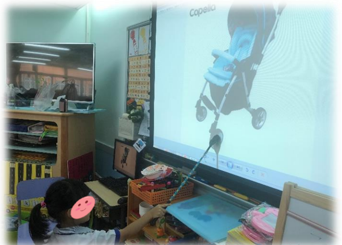
圖 5、圖 6：除了交通工具，生活中也有很多物品也有輪子