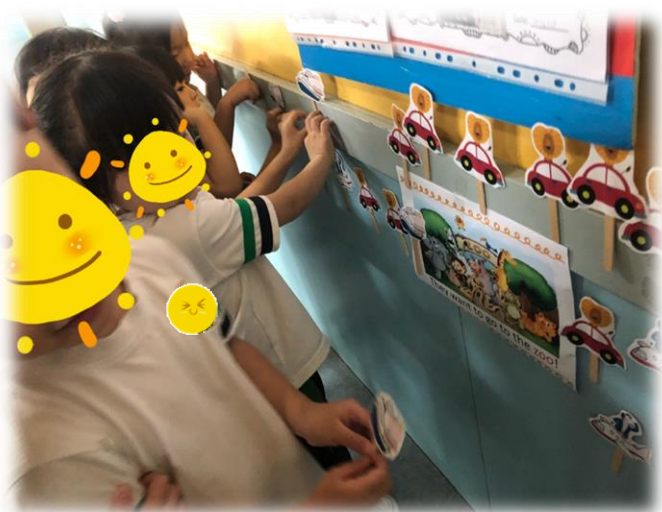
圖 5：幼兒按照地上的指示，把動物送到動物園 Zoo