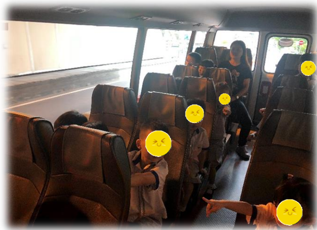
圖 1：幼兒有經過松山隧道的經驗