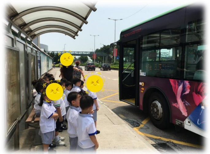
圖 6：幼兒觀察巴士到站及乘客從後門下車