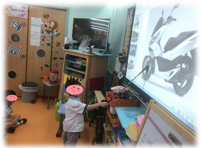
圖 1：通過電腦遊戲證明三角形的輪子不能使汽車行駛 圖 2：幼兒通過觀察，其他交通工具的輪子也是圓形