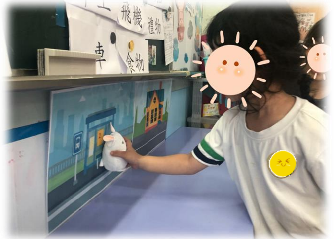
圖 2：幼兒把小兔帶到巴士站內， 並說出「小兔要坐 2 號巴士」