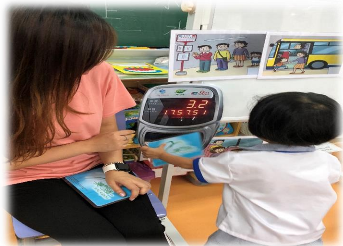
圖 3：老師提醒幼兒上巴士時需要拍卡