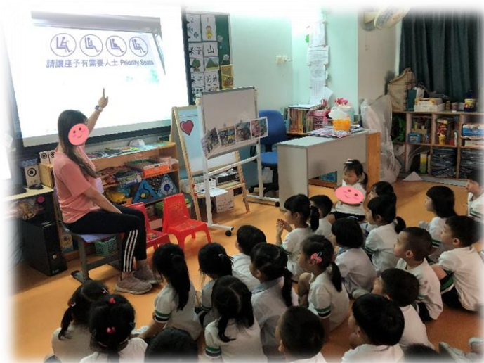
圖 5：提問幼兒關愛座是給哪些人坐