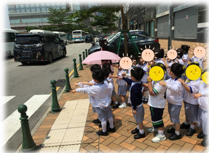
圖 7: 幼兒指出需等車停下才可過班馬線