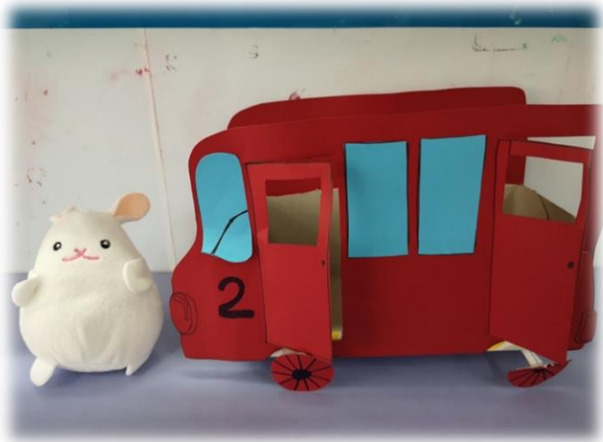
圖 1：《小兔上學去》故事：小兔布偶及巴士模型