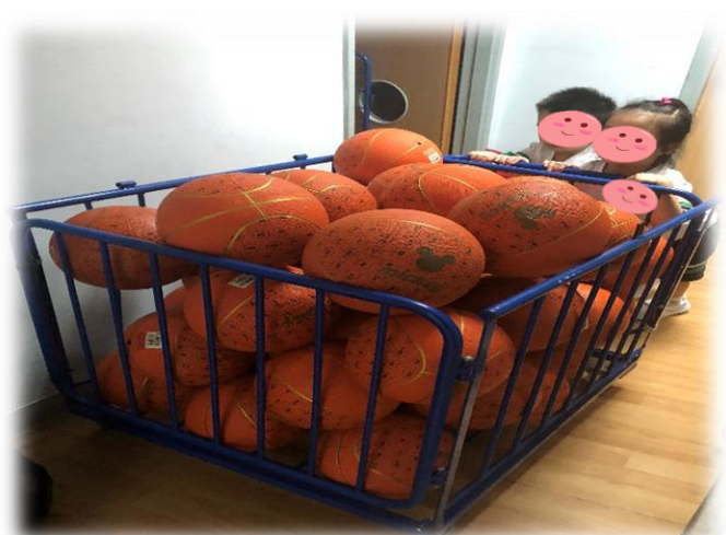
圖 9-12 幼兒通過直觀在學校找出帶有輪子的物品如何為我們生活帶來方便