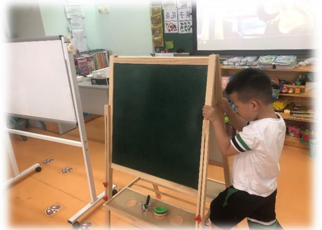
圖 7、圖 8 通過實驗，輪子在我們日常生活中的重要性(在移動物體時可以省力)