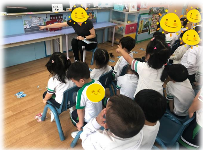
圖 3：幼兒說出在「醫院有救護車」， 並說出小兔不應在此站下車