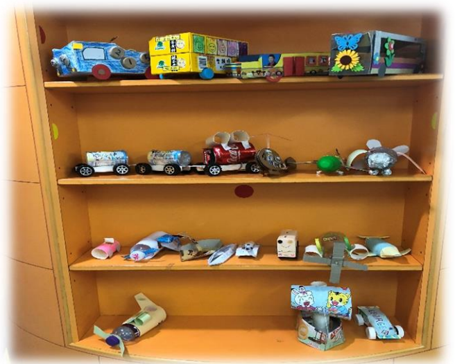
圖 7-10：在走廊設展示區展示幼兒造的交通工具。