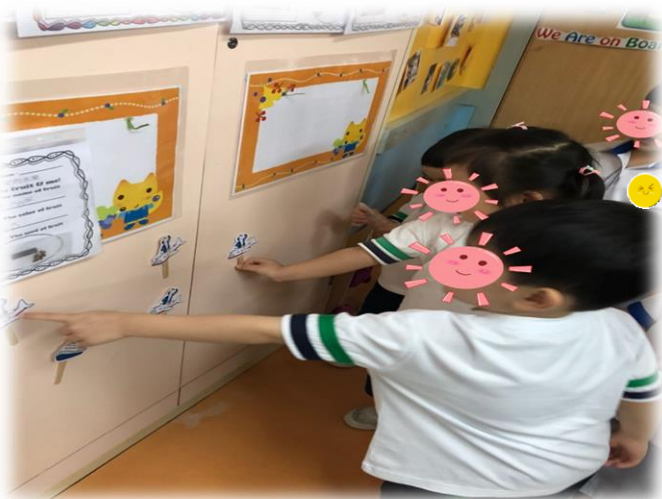
圖 3：幼兒能根據老師指示找到相對應的動物