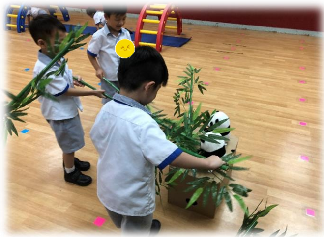
圖 7: 最後到達目的地餵食熊貓