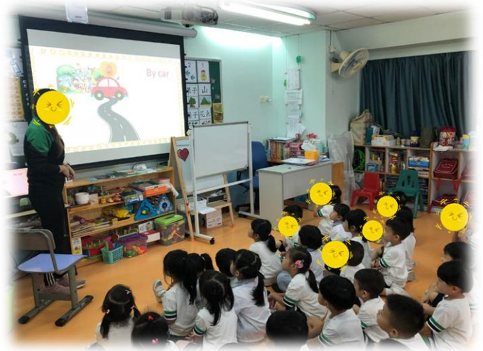
圖 2：頌唱兒歌後，PPT 中的動物成功到達動物園