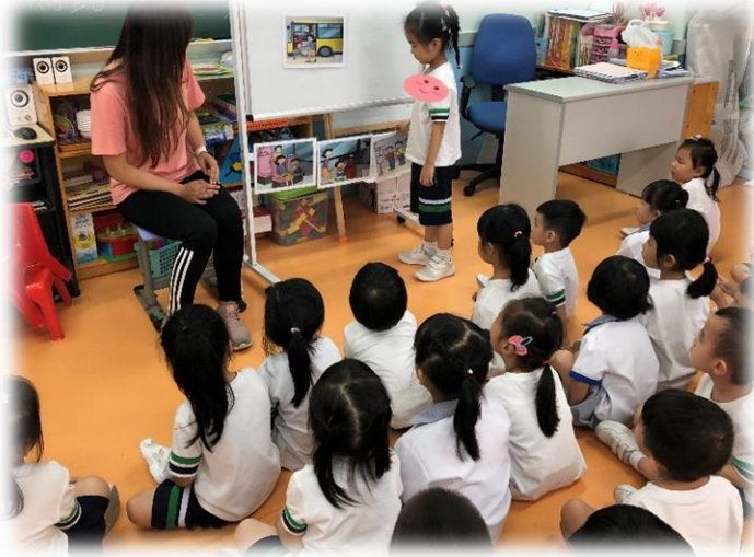
圖 1：請幼兒排出他們認為乘坐巴士的正確步驟