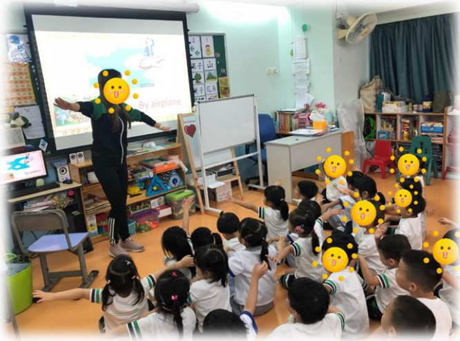
圖 1：老師利用肢體語言帶領幼兒頌唱兒歌 「Going to the zoo」