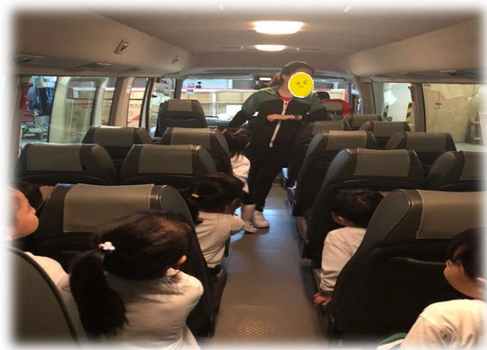
圖 9-10: 延展活動---幼兒參觀學校的停車場