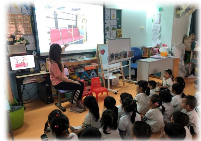
圖 4：提問幼兒有沒有留意巴士上的關愛座