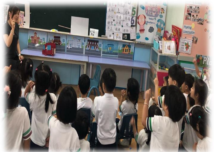
圖 4：幼兒說出小兔到達學校，應在此站下車