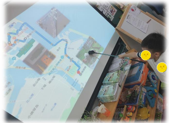
圖 2：創設情景，告訴幼兒如何到達熊貓館