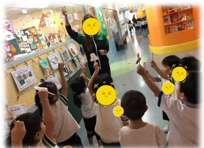
圖 4：幼兒找對動物後舉高，跟老師說「By car!」