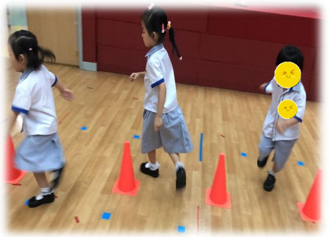
圖 4：幼兒在進行 S 型跑（繞過障礙物）