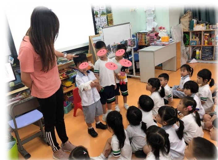
圖 6：請幼兒扮演需要坐關愛座的人