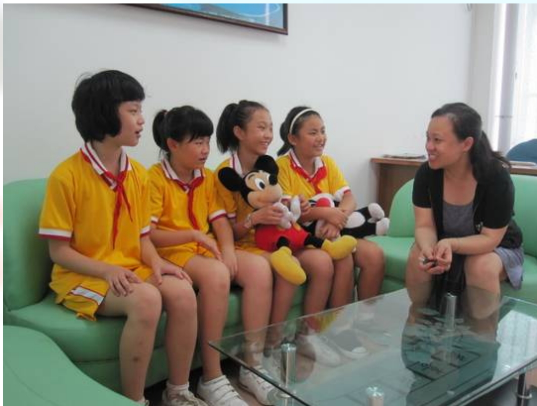
专职心理教师与学生交流