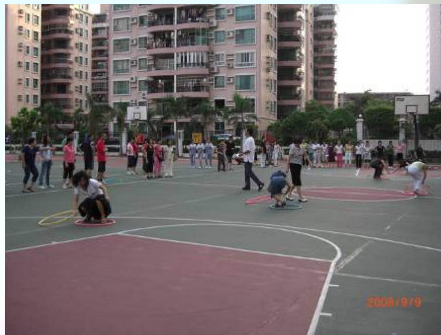
教职工开展体育活动