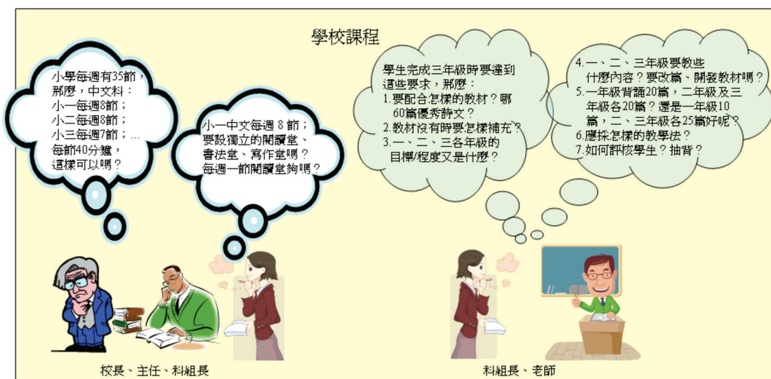
學校持分者參與情況說明圖 (以小學教育階段“中國語文科（第一語文）”為例)