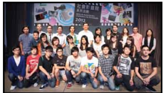
社會影音院系列活動合照

沒有明星，沒有厚厚的劇本，沒有專業拍攝器材，沒有專業的剪接設備，也不是專業的團隊，但有的是能打動人心靈的題材，社會的觸覺，把發生在你我身邊的人和事，運用智能手機、數碼相機拍攝下來。在家中進行剪接，再上載到網絡平台流傳。透過短短數分鐘的影片，引發人們關注社會，期望微電影能更有效地發揮感染力，把人們的訴求帶出，以改善社會。🌱