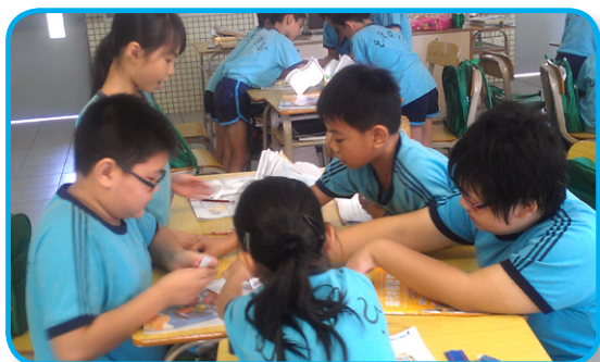
提升學生學習動機

最後，針對課程改革的成效，也需要有相關的評估機制。目前，我校的評估主要有：一、學生的學習成果，任何課程與教學改革都是為了學生，學生的學習表現、學習動機是否有所提升是十分重要的；二、教師教學，了解教師在實施新的課程或教學上是否存在困難，是否對他們的教學有所幫助；三、觀課，從而具體了解課堂教與學的模式發生了怎樣的改變。