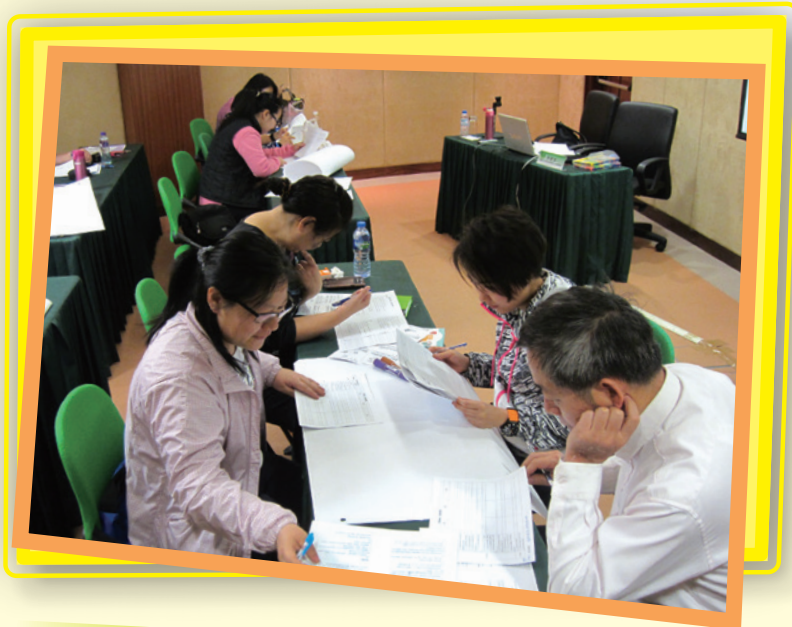
開辦研習課程提升教師落實課程改革的實務能力