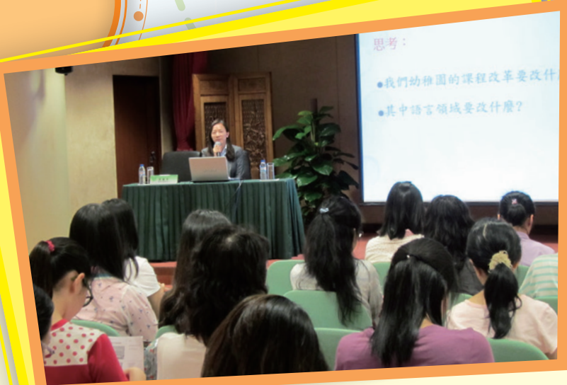
實務分享活動促進教師之間的教學經驗交流

他教師的相關培訓，協助學校更好地理解“基本學力要求”的內容及要求，分享各校的實務經驗，支援學校落實相關工作；