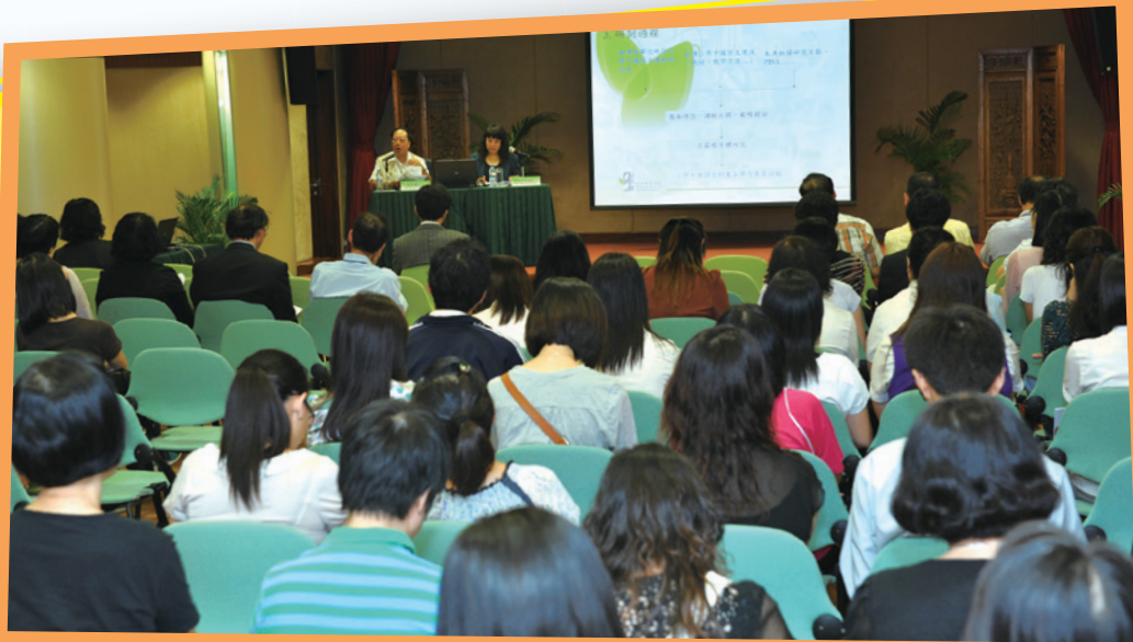
通過講解會等途徑收集教學人員對基本學力要求的意見