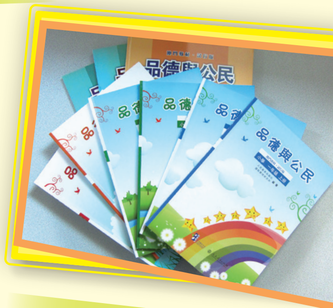
研發配合基本學力要求的教材，豐富教學資源