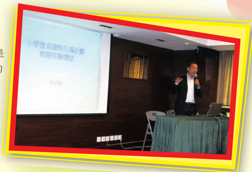
李博士分享先導計劃的指導經驗

特點，在設計時特別關注了多種族、多文化、多語言的特色，在多種語言教學的碰撞下，既要研製出作為第一語言，即教學語言的中文，對象當然是以母語為中文的學生；同時，也要研製作為第二語言的中文，但母語可能同樣是中文的學生，當然也包括了母語不是中文的學生。從學術的角度看，研製作為第二語文的中文科基本學力要求，真是一個非常值得研究的課題。以澳門的土生葡人學生為例，他們的中文聽、說能力是很好的，已