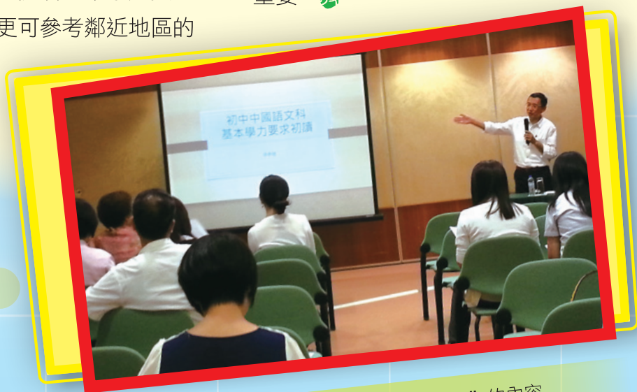
李博士向本澳老師分享初中“中文科基本學力要求”的內容

正如李博士的分享，要有效推動學校的課程發展，教師是最重要的角色。教師在日常繁忙的工作中，要獨自面對及解決教學上的問題，實在不易。而這些教學問題往往具有共通性。何不集合其他教師，發揮共同智慧，同心協力解決教學現場的困惑。要邁出這樣一步，教師心態轉變至為重要。👤