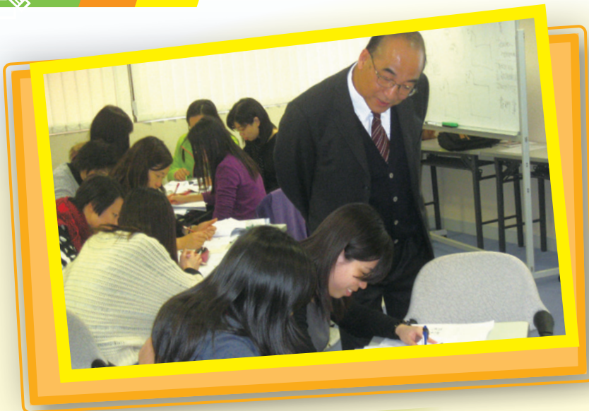
施博士指導本澳老師進行教學設計