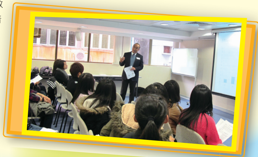
施博士向本澳老師分享英文科教學的最新趨勢

施博士認為澳門的課程改革，正是朝著具自身特色的方向發展。目前只是第一步，要在學校得到落實，還需要有第二步、第三步，循序漸進地進行，切勿急進求成。為此，教師需要擺好正確的心態，將培養學生的整體發展作為教學的指導思維，才不致在一日復一日的教學勞動中，失去了方向，也失去了自我。📖