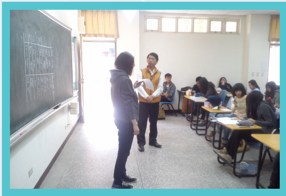
圖 4：同學上台分享取名結果