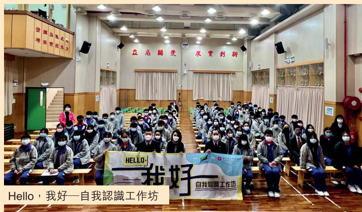
Hello, 我好——自我認識工作坊