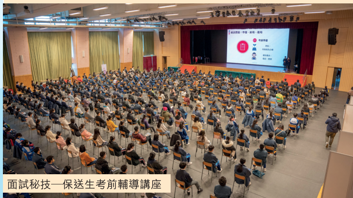
面試秘技——保送生考前輔導講座