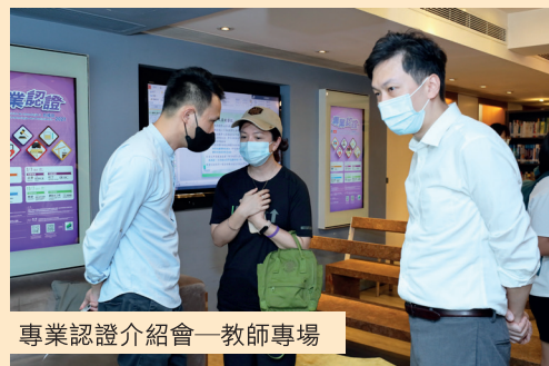
專業認證介紹會——教師專場