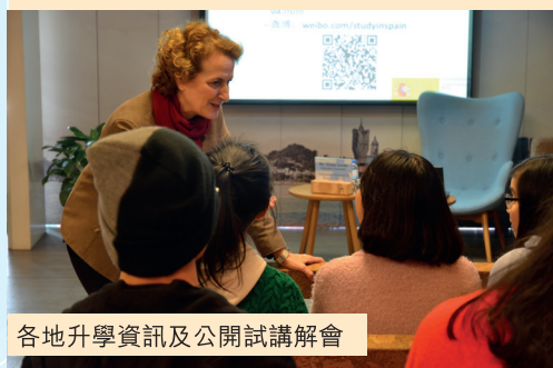
各地升學資訊及公開試講解會