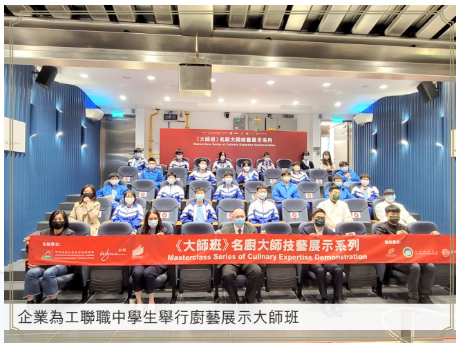
企業為工聯職中學生舉行廚藝展示大師班

工聯職業技術中學因其辦學背景而有着不同的社會觸覺。黃主任表示，“政府+學校+企業+工會”是辦好職技教育的保證。工聯職業技術中學最大的優勢是有工聯作為辦學實體在背後的支持。作為本地工會聯合組織，工聯對本澳人才發展、企業對人才的需求的接觸最直接、最深入。因此工聯轄下的教育委員會適時根據社會實況給予我們指導意見，也將我們的意見向企業、政府反映，使得各方溝通更通