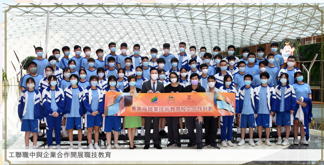
工聯職中與企業合作開展職技教育

暢，從而因應社會發展確定培育人才的方向。校企合作是職技最重要的實踐教育，工聯職業技術中學與H3C公司、MGM、各中小企業等企業合作形成了理論與實踐相互融合的合作模式。根據市場上對應用型人才的需求，工聯職業技術中學對教學環境和教學內容的進行改革，並按照實踐原則進行教學，推廣了突出“好學 致用 求新 務實”理念的教學法，着眼市場，發展職業教育校企聯辦，培育實用人才。