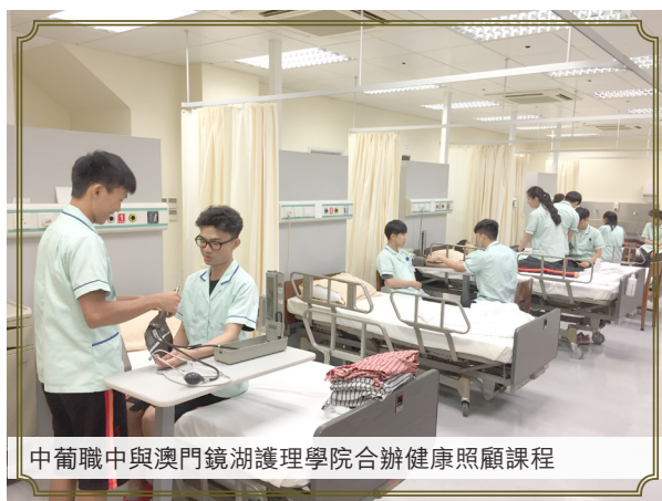
中葡職中與澳門鏡湖護理學院合辦健康照顧課程

校的出現，多數是一所學校含有六年中學教育，包括三年初中教育和三年職技高中教育；又或者是在高中教育階段同時開設了普通高中課程和職技高中課程。因此，職業技術學校仍需要一定量的普通課程教師，同時也需要該職技課程專業的教師。學校尋找師資時，尤其在聘請任教專業技術領域方面的教師，會不會存在困難呢？