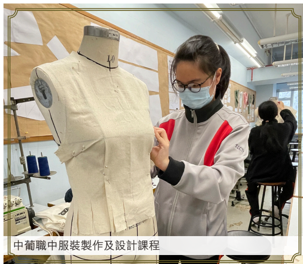
中葡職中服裝製作及設計課程