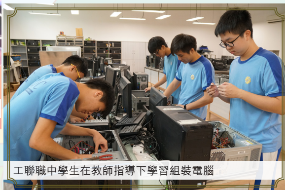
工聯職中學生在教師指導下學習組裝電腦