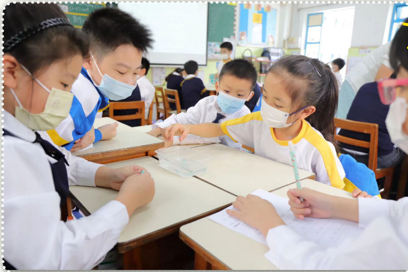
課堂以學生為中心，學生有更多機會動手操作