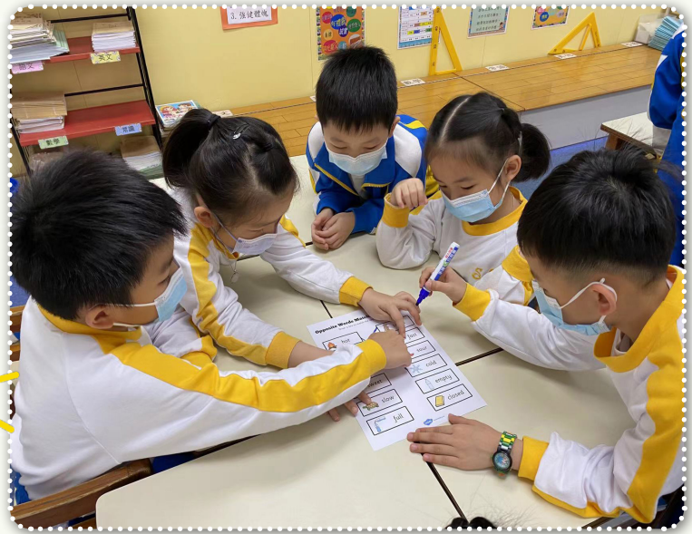
教學設計的實施有效提高學生的學習動機